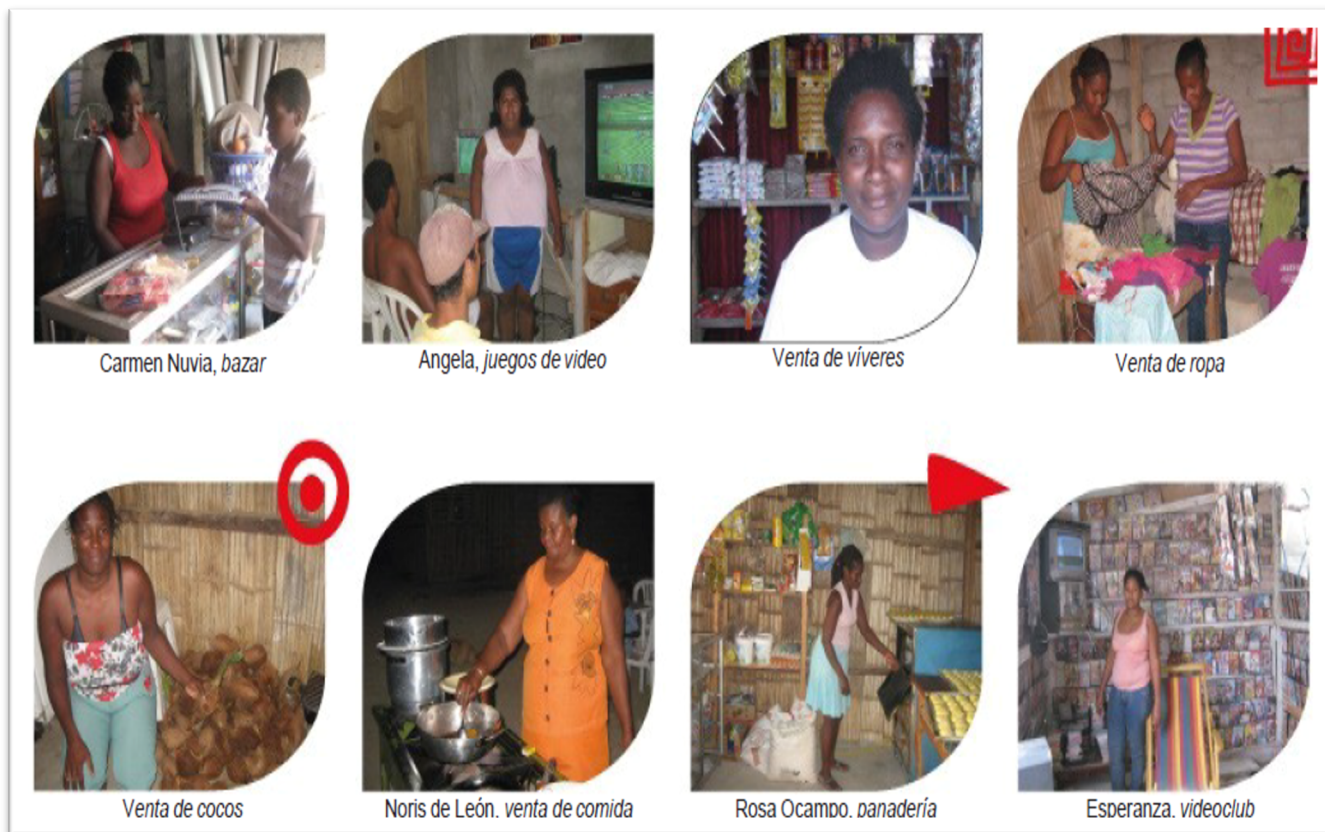
Figura 4 Emprendimientos de las socias

En alianza estratégica con la Universidad Politécnica del Litoral, levantaron un estudio de factibilidad para identificar los riesgos de competitividad de los emprendimientos y así evitar conflictos entre las compañeras. Para ello, realizaron un mapeo comunitario sobre la ubicación geográfica de cada negocio en todo el sector; con esta información se comenzó a otorgar créditos para nuevos negocios en lugares que permitieran descentralizar el mercado y así brindar la oportunidad de que todas las socias pudieran vender sus productos, recuperar su inversión, ganar su utilidad y pagar a tiempo el crédito.