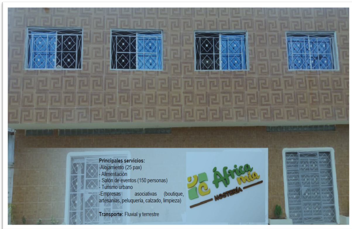
Figura 5 Hostería Comunitaria “Africa Mía”