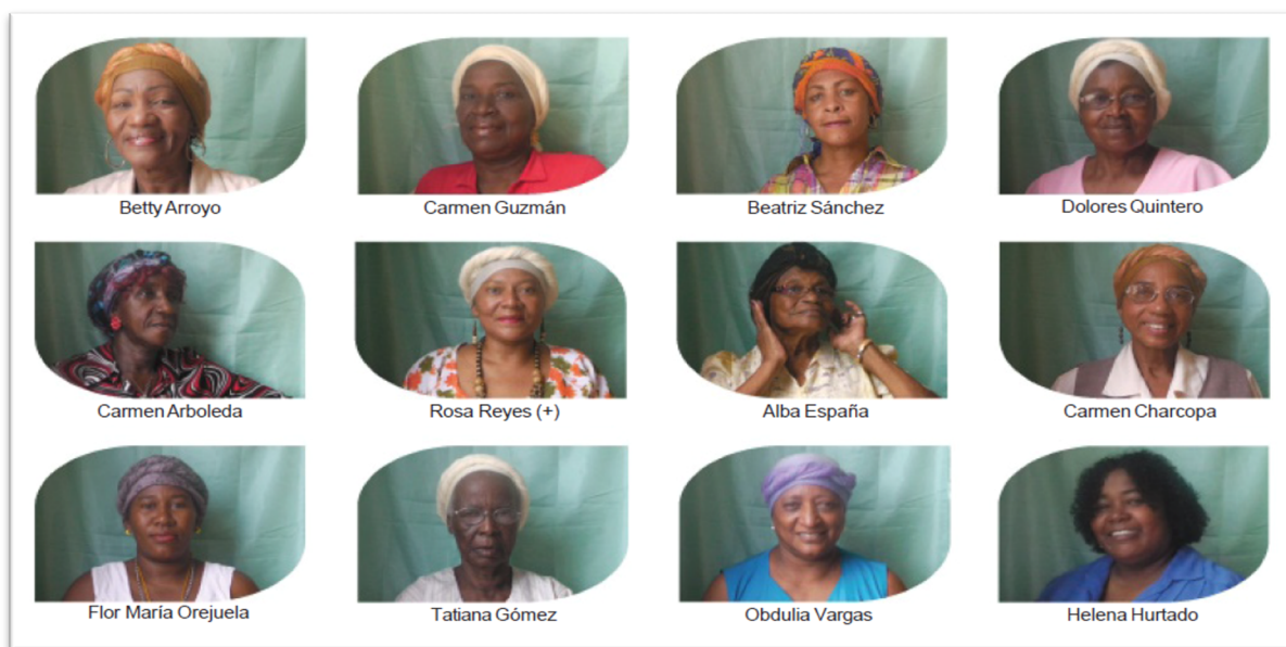
Figura 2 Lideresas de la agrupación